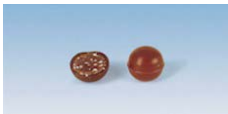
One-Shot con ingredientes

Bombones, trufas, huevitos y bombones de licor estándar One-Shot