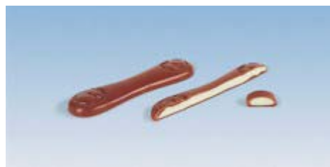
Barras rellenas largas One-Shot