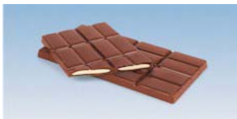
Tabletas largas One-Shot

Para todo tipo de relleno, inclusive con ingredientes.