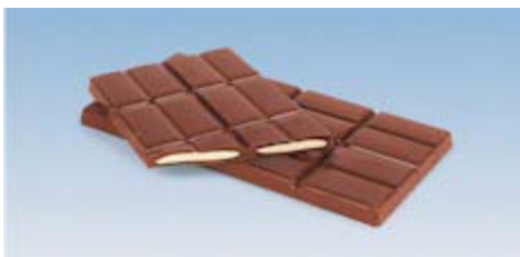
Tabletas largas One-Shot