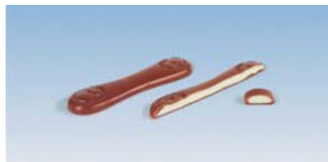
Barras largas rellenas One-Shot